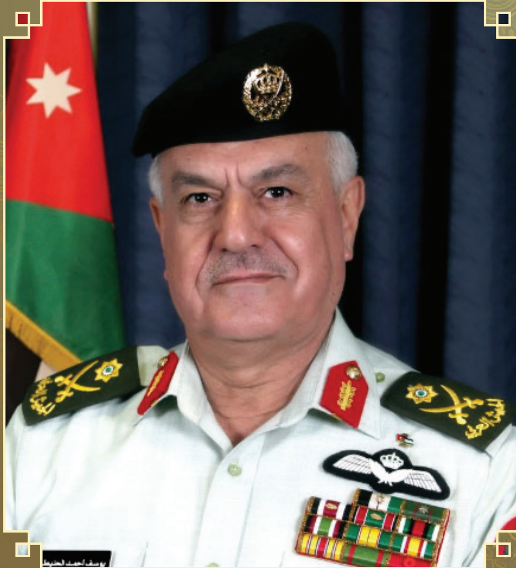
رئيس هيئة الأركان المشتركة اللواء الركن يوسف أحمد الحنيطي