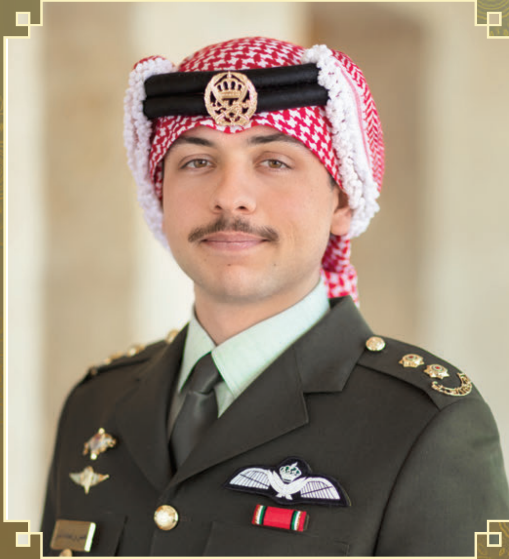
صاحب السمو الملكي الأمير الحسين بن عبدالله الثاني ولي العهد المعظم