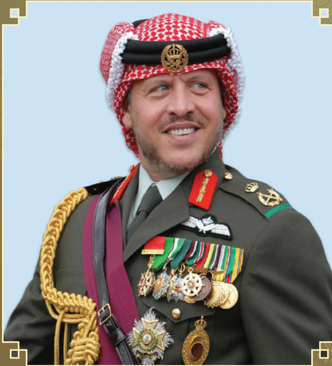
حضرة صاحب الجلالة الملك عبدالله الثاني ابن الحسين المعظم القائد الأعلى للقوات المسلحة الأردنية